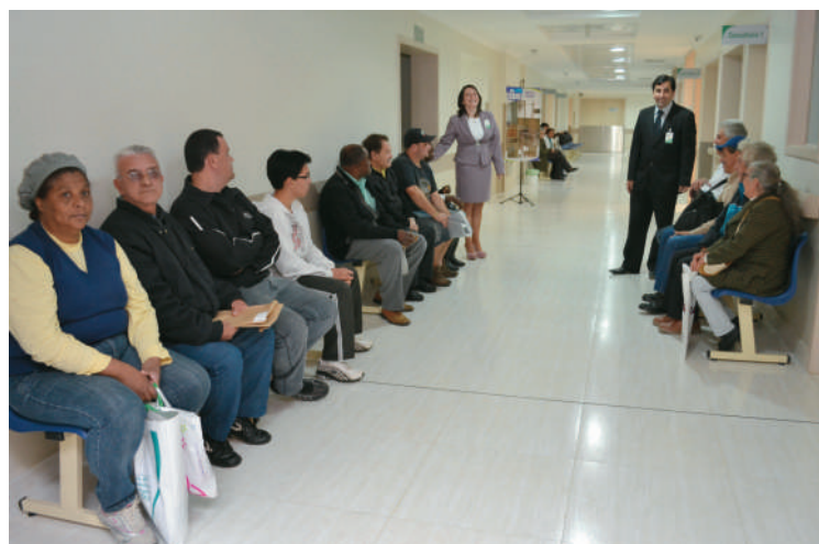
Os primeiros 20 pacientes começaram a ser atendidos ainda no dia 28