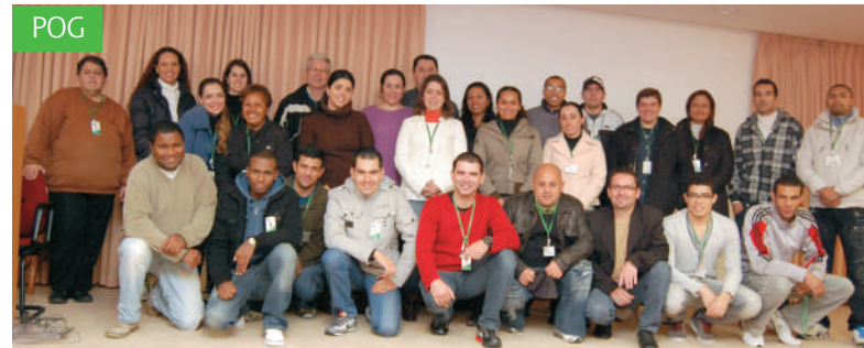
O Programa de Orientação Geral, realizado no dia 27 de agosto, teve a presença de 35 novos colaboradores.