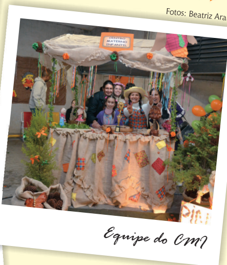
Equipe do CM?