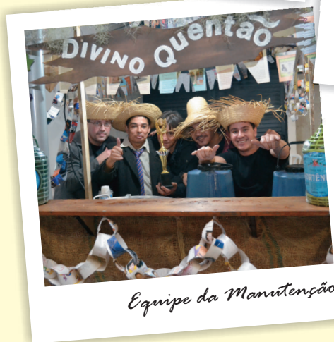
Equipe da Manutenção