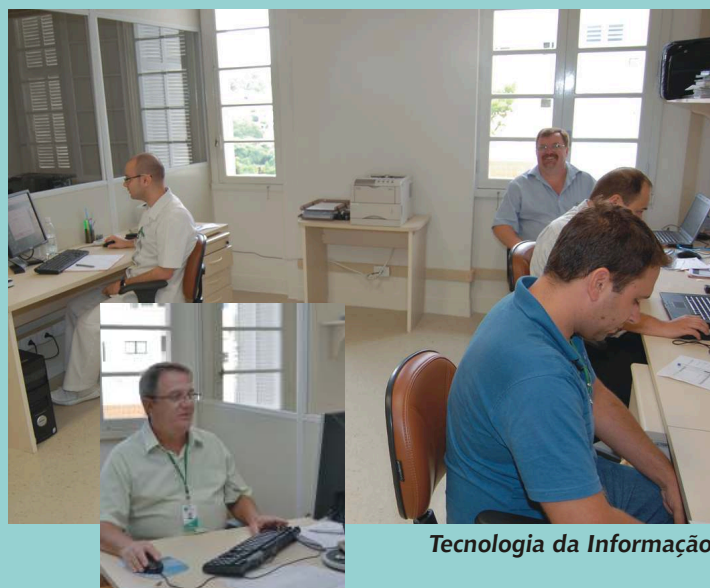
Tecnologia da Informação