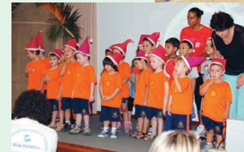
Crianças encantaram os funcionários