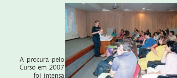
A procura pelo Curso em 2007 foi intensa

“Nossa avaliação é positiva. O pessoal elogia bastante o que é abordado e a maioria das gestantes opta por ganhar o bebê na instituição”, relata.