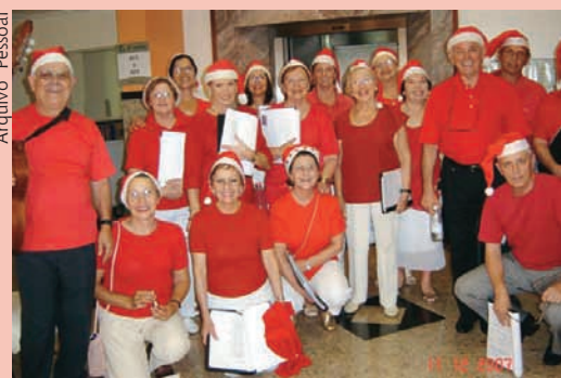
Grupo foi acolhido com muita alegria

As canções natalinas encheram os corredores e setores do Hospital no dia 11 de dezembro, ao final da tarde. Mais uma vez o Coral Decolores, do Movimento de Curfílios de Cristandade de Porto Alegre, se apresentou para pacientes, familiares e funcionários. O grupo entoou canções nas unidades de internação, CTI Adulto, Centro Cirúrgico e Centro Materno-Infantil.