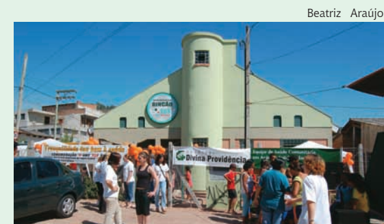
Equipes se uniram para atender a comunidade