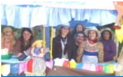
CME e CC foram responsáveis pelo pínhão e amendoim