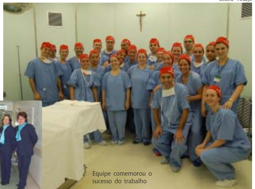
Equipe comemorou o sucesso do trabalho

Secretárias do CC receberam os convidados