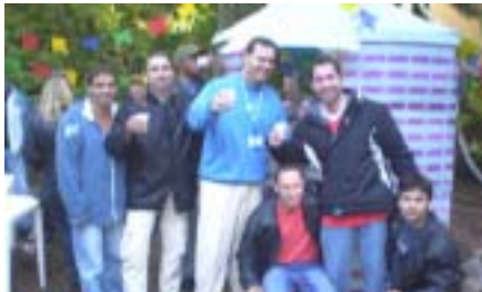
Garrafão de vinho foi confeccionado pela equipe da Manutenção