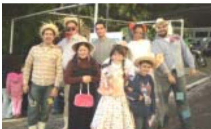
Colegas se vestiram com trajes típicos de São João