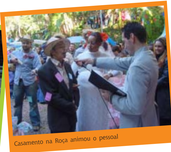
Casamento na Roça animou o pessoal