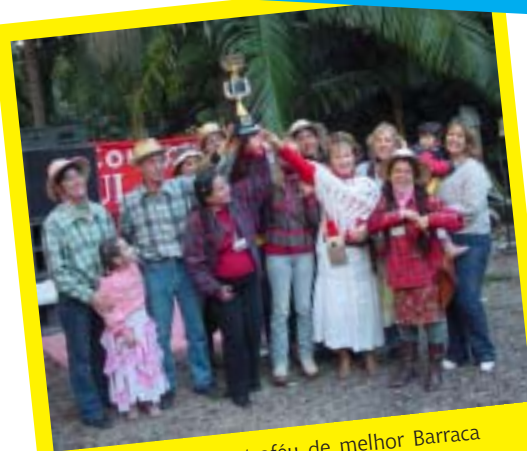
PSF Rincão levou o troféu de melhor Barraca