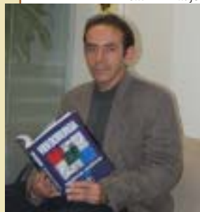
Livro mostra as evoluções técnicas na videocirurgia