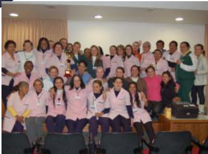
Equipe do SND foi a grande vencedora da gincana do agasalho