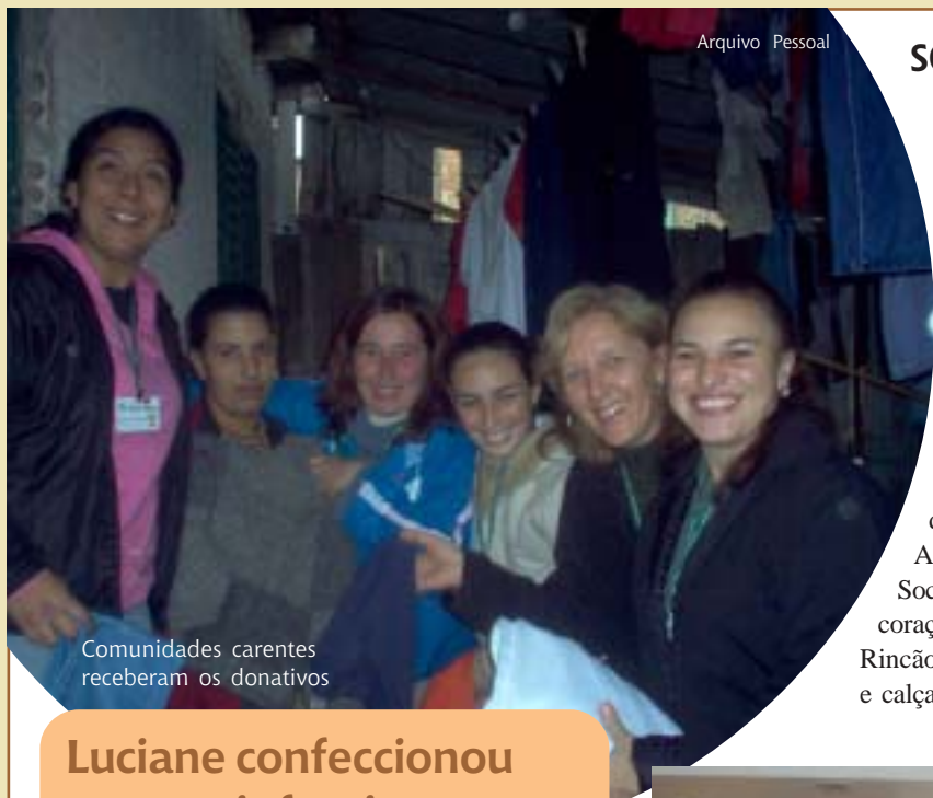
Comunidades carentes receberam os donativos