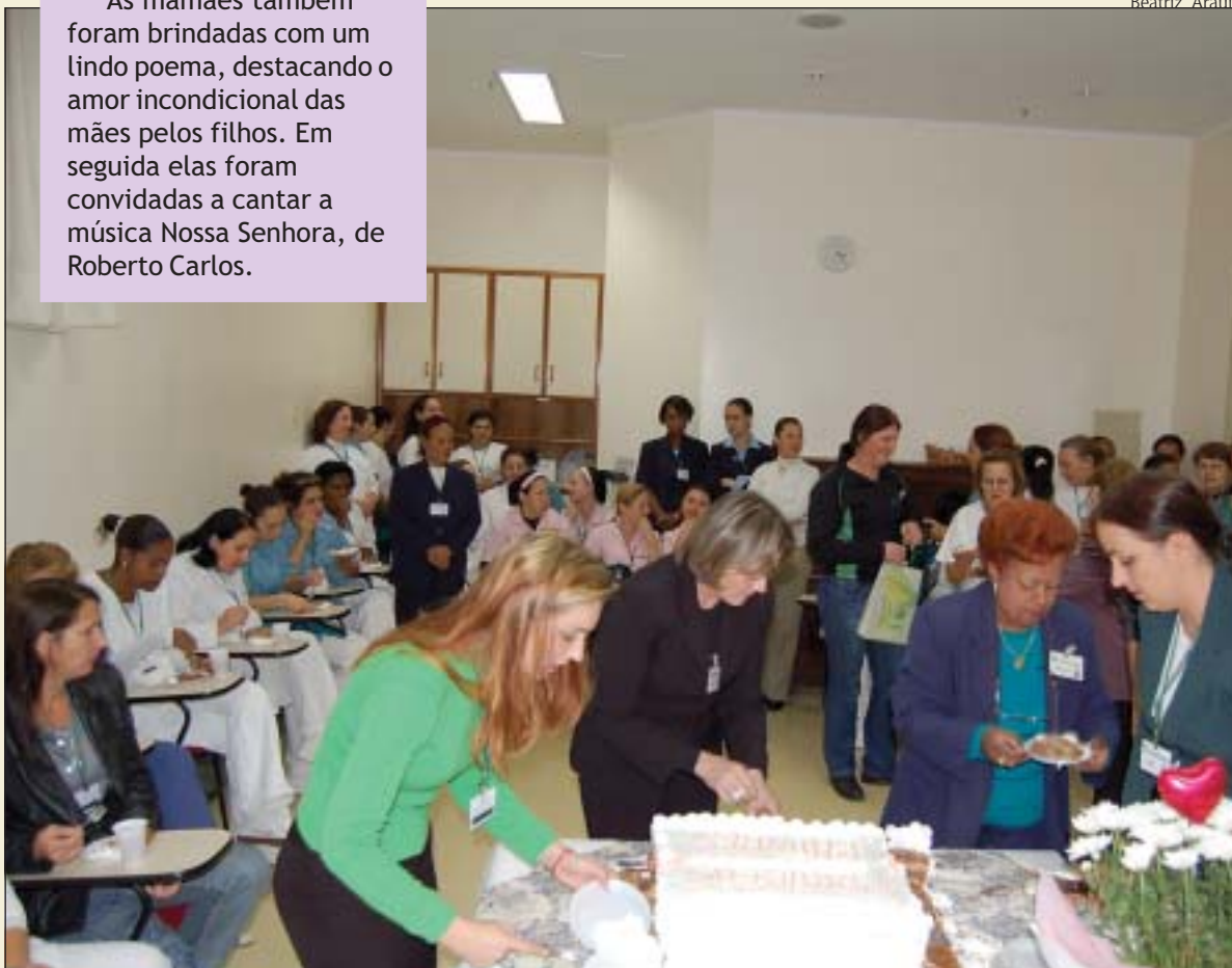
Mamães colaboradoras adoraram a homenagem