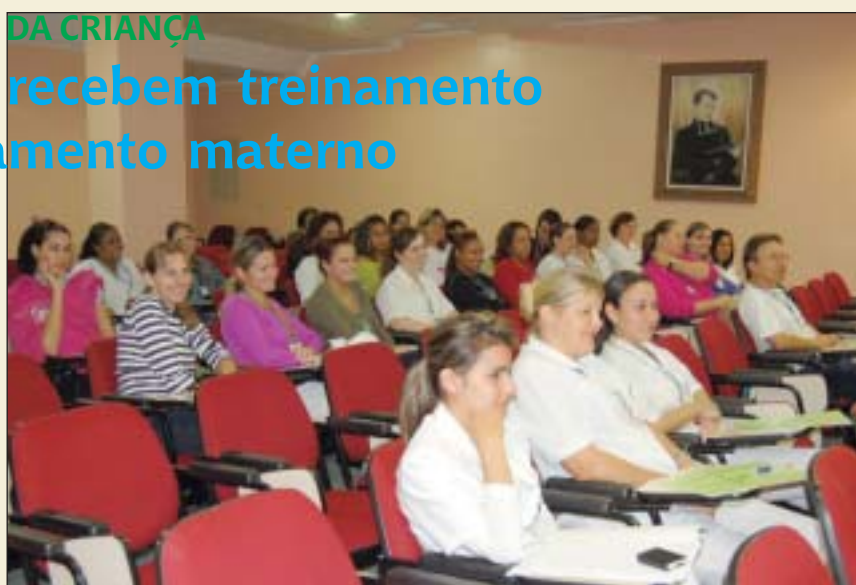
A sala de espera e a recepção qualificaram o atendimento

O grupo falou sobre a importância do aleitamento