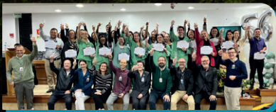
Jubilados que completam 5 anos de casa.