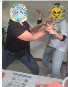
No HE, a pauta foi tratada com uma dinâmica lúdica!