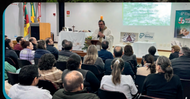
Missa em Ação de Graças.