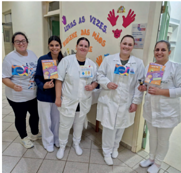
Blitz no Santa Isabel!

As unidades da RSDP celebraram o Dia Mundial de Higiene das Mãos com atividades especiais voltadas à conscientização sobre a importância dessa prática simples e fundamental para a segurança dos pacientes e pessoas colaboradoras. As ações reforçaram o cuidado diário e o papel de cada um na prevenção de infecções, fortalecendo a cultura de segurança em todos os ambientes da nossa Rede.