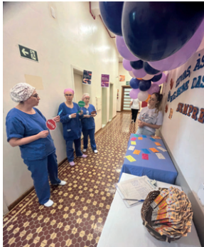
São José também abordou o tema.