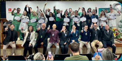
Jubilados que completam 5 anos de casa.

Gratidão à quem faz o faz o Divina todos os dias: nossas pessoas colaboradoras!