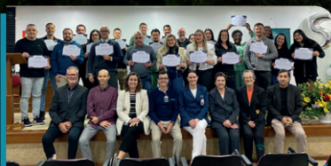
Jubilados que completam, 5, 10, 15 e 20 anos de casa e atuam à noite.