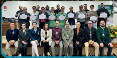
Jubilados que completam, 5, 10, 15, 20 e 30 anos de casa e atuam à noite.