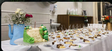
Bolo comemorativo ao aniversário.