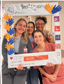
Parada para conscientização no Independência.