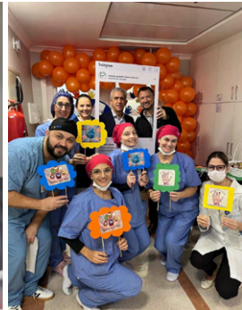
Ação na Endovascular do HD.