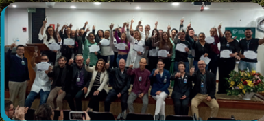
Jubilados com 10 até 30 anos de casa.