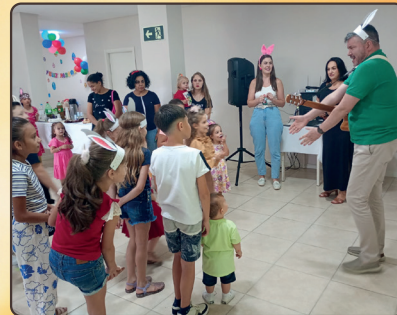
He: foi realizada uma atividade especial com os filhos das pessoas colaboradoras do hospital, unindo criatividade e muita diversão.