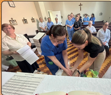
Hsj: uma celebração ressaltou o verdadeiro sentido da Páscoa nos corações das pessoas colaboradoras.