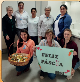
Hsi: a data foi marcada com a entrega de bombons às pessoas colaboradoras e uma missa na igreja da cidade.

A Páscoa é um tempo especial para a Rede de Saúde da Divina Providência. Com gestos simples e cheios de significado, ela foi celebrada nos nossos hospitais, trazendo o espírito da renovação, da esperança e do amor de Cristo em nossas vidas. Confira como foi: