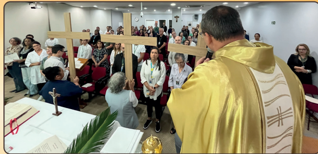
Hd: as equipes também participaram de uma celebração e uma encenação religiosa, refletindo sobre o verdadeiro sentido da Páscoa.