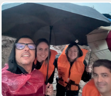
Aproveitamos esta edição do DER para agradecer àquelas que não foram afetados e estão trabalhando para apoiar os seus colegas. E também aos que, mesmo afetados, seguem na luta. Até de barco nosso pessoal se deslocou para manter os atendimentos no Vale do Taquari.