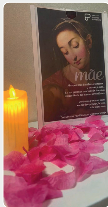
Apesar de tudo, o Dia das Mães não passou despercebido.