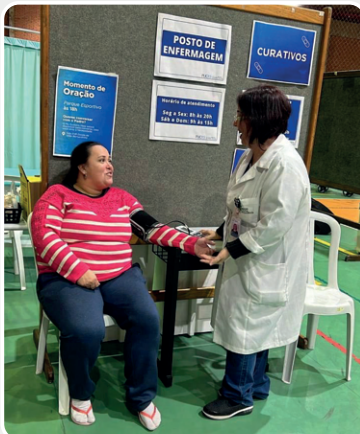
Equipes das APS prestando atendimentos aos abrigados na PUCRS.