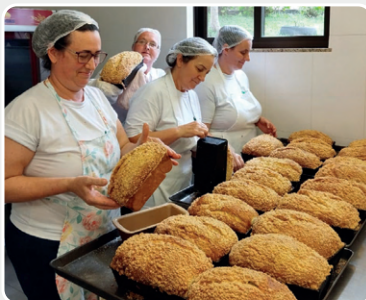
Cucas para alegrar!