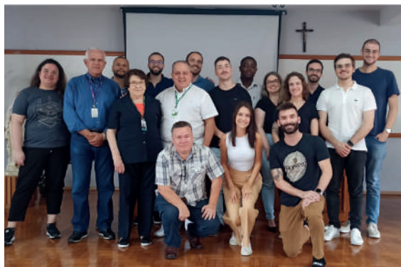
Novos Residentes, Comitê Gestor do HI e Coordenador do COREME.

Já na Residência Multiprofissional e Uniprofissional, a RSDP contará, ao longo dos próximos 2 anos, com a participação de 16 residentes que ingressaram no Programa de Residência Multiprofissional e Uniprofissional da Saúde PREMUS, vinculado à Escola de Ciências da Saúde e da Vida - PUCRS, em parceria com a Rede de Saúde da Divina Providência. As áreas temáticas do Programa englobam Saúde do Idoso, Urgência e Apoio Diagnóstico e Terapêutico. Os residentes atuarão nos Hospitais Divina, Independência, Hospital Santa Ana, Hospital São Lucas e Unidades de Saúde de Porto Alegre.