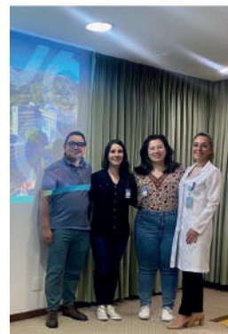
1ª turma da Farmácia do HD