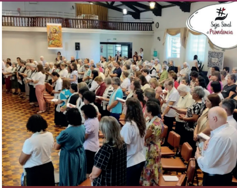
Missa de encerramento do Capítulo da Província das Irmãs da Divina Providência.

"Como Vida Religiosa Consagrada artesã do cuidado e peregrinas da esperança, no dinamismo pascal das Mulheres da Aurora, seguimos Jesus Cristo, e juntas nos comprometemos na defesa da vida. Somos sinal da Providência!"