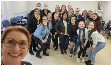
A turma do Hospital Estrela reunida na qualificação

O curso de Atendimento ao Cliente está sendo oferecido aos colaboradores que têm contato direto com o público nos hospitais da RSDP, como recepcionistas, porteiros e telefonistas. A qualificação ocorre por meio de parceria entre o Centro de Ensino e Pesquisa e o Unilasalle. Entre os temas, estão o relacionamento profissional humanizado, ética e prática de atendimento. As aulas começaram em maio, no HDP e HI, e prosseguem até julho, no HE, HSI e HSJ.