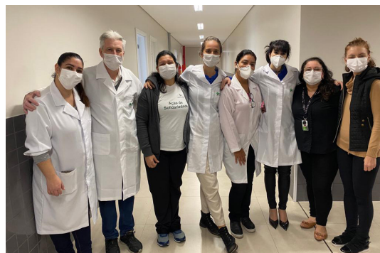
A equipe responsável motivada com as atividades

"Cuidando de quem cuida" foi o evento promovido pela Clínica da Família Campo da Tuca, juntamente com o Núcleo de Atenção Primária à Saúde e o Ambulatório de Terapias Naturais e Complementares (ATNC), no final de maio.