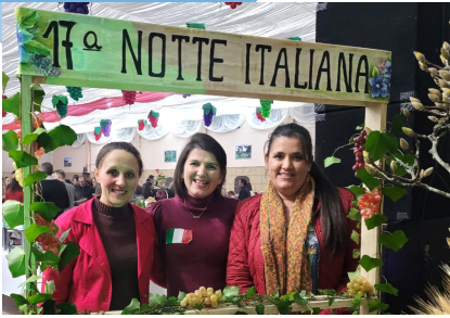
Grande participação demonstra carinho pelo HSI