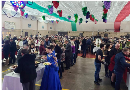
As Soberanas do município de Progresso abrilhantaram a festa