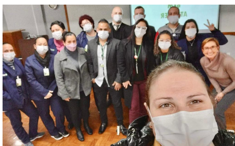
Aula para a equipe do Divina Providência