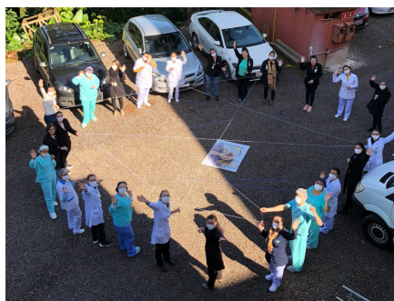
Equipe do HSJ teve participação ativa na dinâmica