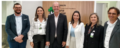
Integrantes da Comissão Arroio do Meio Pró-UTI

O ato teve a presença de mais de 100 pessoas entre autoridades, lideranças comunitárias, médicos, Comitê gestor e colaboradores do hospital, além da comunidade de Arroio do Meio.