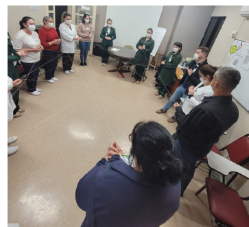
Pessoal do HSI se uniu para formar conexões em rede