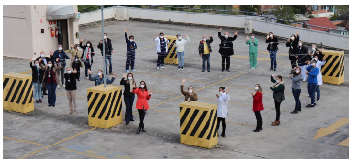
HDP mobilizado na atividade interativa