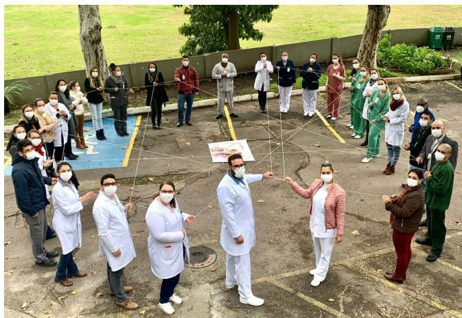
Grupo do HI demonstrou a formação de uma rede