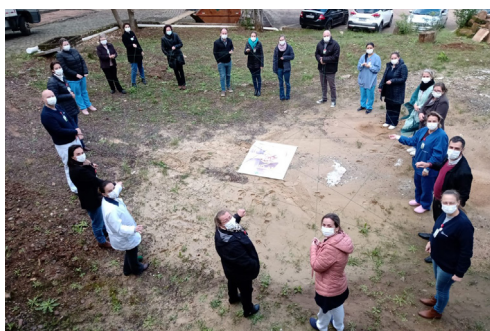
HE disse presente nos dez anos de RSDP