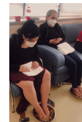
HDP ofereceu um delicioso escalda pés às mães