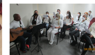
HI realizou missa pela data