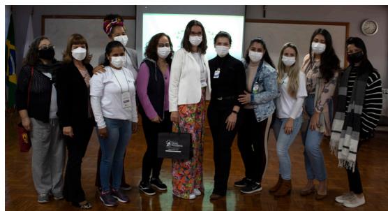
Equipe teve importante atuação para o sucesso do evento

O 1º Encontro de Práticas Integrativas e Complementares em Saúde (PICS), organizado pelo setor de Responsabilidade Social nos dias 29 e 30 de abril, teve 253 participantes nas atividades online e presenciais. Foram seis palestras, duas rodas de conversa, quatro relatos e sete vivências. Na RSDP, as PICS beneficiam, atualmente, pacientes das UTIs Adulto e Neonatal do HDP, os usuários das unidades de saúde de Porto Alegre e do Ambulatório de Terapias Naturais e Complementares, além dos colaboradores dos hospitais Divina Providência e Independência.