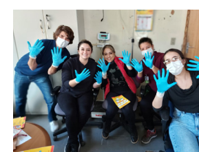
Unidades de Saúde