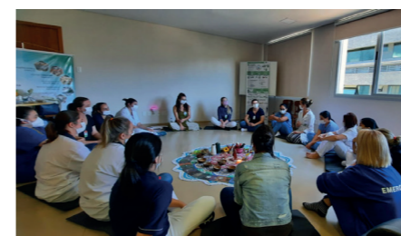
Colaboradoras do HE em um dos momentos de reflexão e partilha