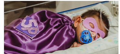
No HE, os nenês ganharam fantasias e foi exibido vídeo para os pais e colaboradores