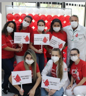
Equipe preparou as atividades com muito carinho e cuidado