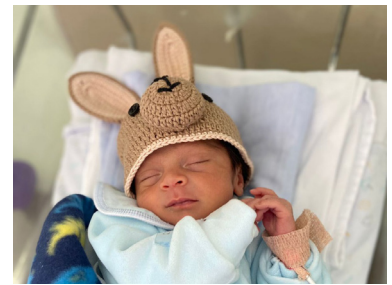
No HDP, houve palestras e os bebês foram vestidos de cangurus

Na UTI do HE, os bebês ganharam fantasias de "super prematuros" e de borboletas. Os pais e os colaboradores assistiram a um vídeo em que profissionais relatam sobre a prematuridade, sobre a rotina de trabalho da equipe na Neonatal, além de mostrar fotos de "antes e depois" dos bebês.