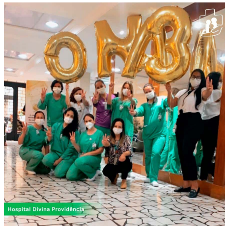
Hospital Divina Providência

Esse avanço somente foi possível graças ao comprometimento dos colaboradores. Nosso agradecimento a cada um e a cada uma que assumiu a sua parte no processo, o que valoriza, ainda mais, a nossa Acreditação. Parabéns!