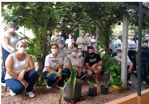
Colaboradores reunidos para orar pelo HSI