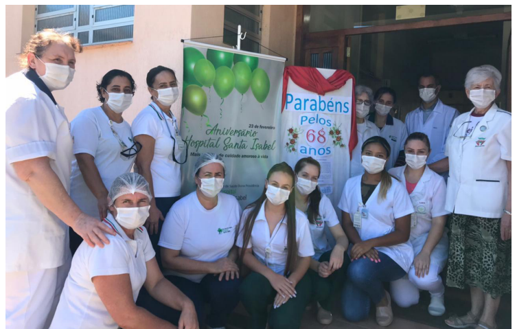
Fachada enfeitada para celebrar o aniversário

De lá pra cá, muitas conquistas, mas a maior delas é a confiança e carinho da comunidade ao HSI, que é referência para 11 municípios da região. Recebe mais de 90% dos pacientes pelo SUS, e conta com uma estrutura de 50 leitos, 12 médicos e 66 funcionários, oferecendo os serviços de Clínica Médica, Pediatria, Obstetrícia Clínica, e uma Unidade de Atendimento COVID-19 com áreas exclusivas de triagem, espera, atendimento médico e internação.