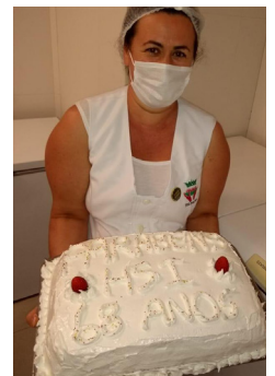
Um delicioso bolo foi oferecido aos colaboradores