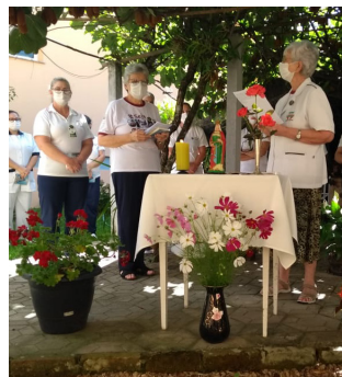
Irmãs conduziram a celebração de aniversário