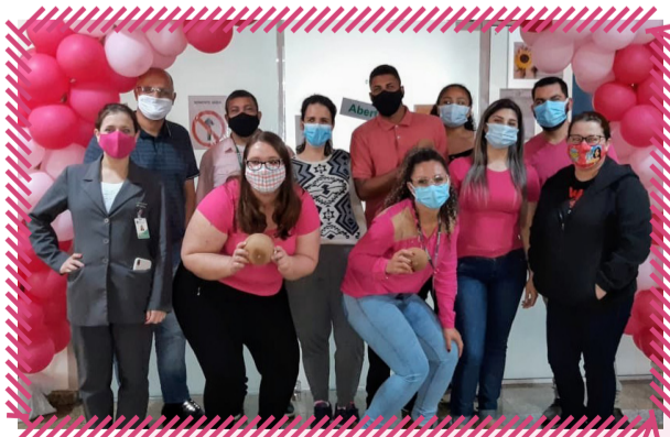
Hospital Independência: a "terça-feira rosa" com sobremesa especial e dicas de autocuidado movimentou o HI