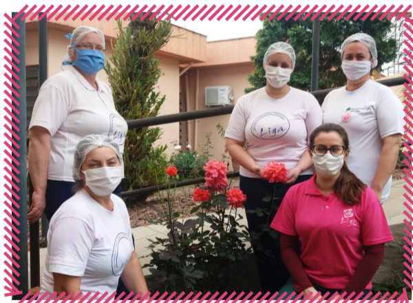
Hospital Santa Isabel: Junto à Liga Feminina de Combate ao Câncer, laços foram entregues aos colaboradores