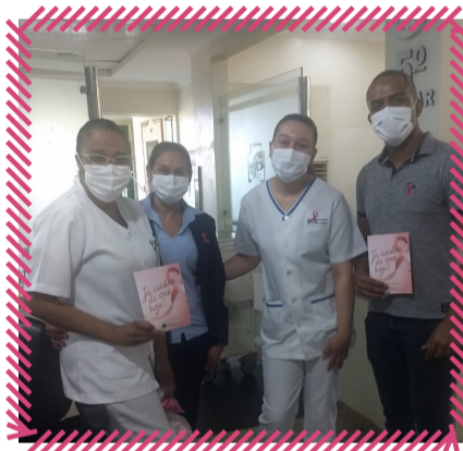
Hospital Divina Providência: foram distribuídos laços e bottons aos colaboradores do HDP

S abemos da importância que o Outubro Rosa tem. Por isso, todos os anos, reunimos nossos colaboradores para lembramos, internamente, dos cuidados e da prevenção ao câncer de mama, afinal, para cuidar da saúde das pessoas, precisamos primeiro cuidar da nossa. Veja as atividades em nossos cinco hospitais!