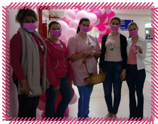
Hospital Estrela: Laços foram distribuídos aos colaboradores e o hospital foi adesivado em alusão à data