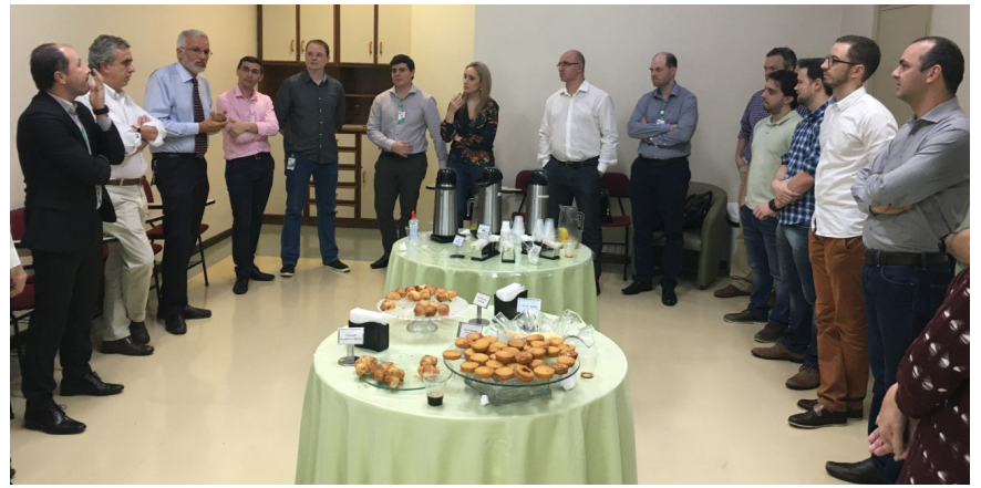
Equipe reunida pensando em melhorias

O Hospital Divina Providência é reconhecido por sua excelência em Cardiologia. Ainda assim, está sempre preocupado em melhor atender seus pacientes. Semanalmente, uma equipe renovada de médicos se reúne para discutir casos e pensar em projetos que agreguem ainda mais qualidade ao atendimento prestado. Pensando nisso, foi implementado o Fast Track da Cardiologia na Emergência do hospital. O sistema aperfeiçoa e acelera o atendimento que, atualmente, conta com um cardiologista durante o dia. O Fast Track é ativado imediatamente em possíveis casos de emergência cardiológica pelo sistema de triagem. Com isso, o eletrocardiograma é feito, unindo agilidade e excelência no atendimento. "O paciente com suspeita de doença cardíaca aguda é atendido rapidamente, tem seu exame avaliado por um especialista num curto espaço de tempo." conta o coordenador do Fast Track