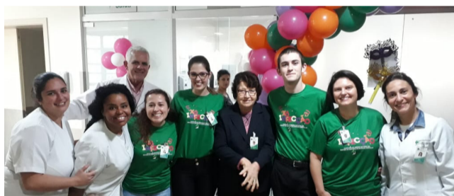
HI passou, também, nos setores com o Bloco Xô Infecção