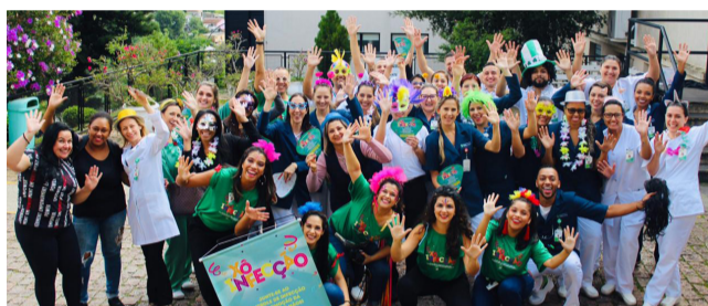
HDP promoveu o Bloco Xô Infecção e passou nos setores do hospital

Maio é um mês de celebração nos Serviços de Controle de Infecção Hospitalar (SCIH), visto que o dia 5 é o Dia Internacional da Higiene de Mãos. Pelo mundo, são realizadas diversas ações de conscientização motivando todos os envolvidos na assistência hospitalar segura. E na RSDP, os setores do SCIH desenvolveram atividades de sensibilização sobre a importância desta medida, que é a mais simples e mais importante aliada na prevenção das infecções relacionadas à assistência à saúde. Confira!