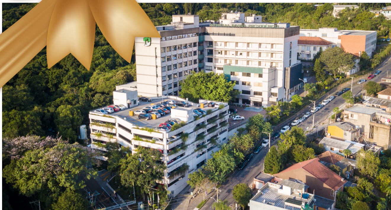
A semana do cinquentenário foi marcada por diversas atividades