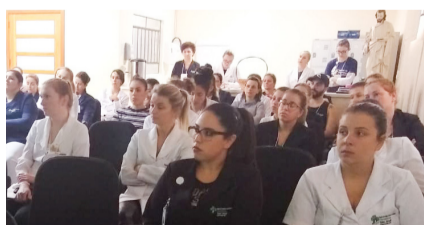
HSJ trabalhou a responsabilidade dos registros de comunicação e suas implicações legais. A importância da comunicação afetiva também teve muito apelo, além de oficinas sobre registros de enfermagem