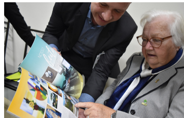
Em um coquetel especial para Irmãs, Capelães e os presentes da RSDP, houve a entrega da revista e do pin comemorativos dos 50 anos

Vida longa ao Hospital Divina Providência!