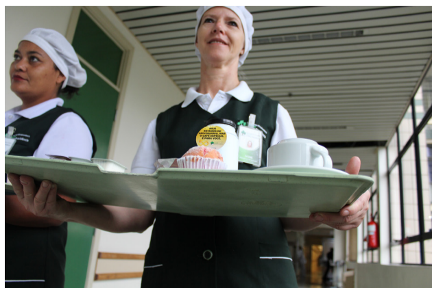
Na sexta, 31, os pacientes foram presenteados com cupcakes