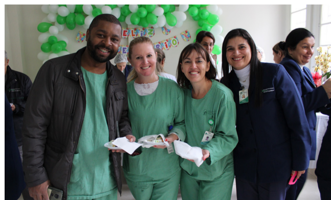
No mesmo dia, um grande almoço festivo de confraternização para celebrar quem constrói a história Divina: cada colaborador!