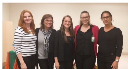
HI focou na terminalidade, acolhimento e espiritualidade. Trabalhou, ainda, a importância dos cuidados paliativos em várias palestras

A 1ª Semana de Enfermagem da RSDP abordou a melhoria da assistência por meio dos cuidados. Cada hospital deu ênfases específicas, desde a importância dos cuidados paliativos, passando pela responsabilidade na comunicação e transição do cuidado até a apresentação de cases de sucesso.