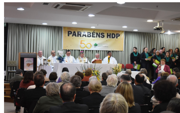
Na quinta, 30, a celebração eucarística, momento de reflexão e agradecimento por fazermos parte de um projeto humano e solidário