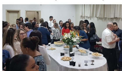
HDP apresentou, além das palestras centrais com temas atuais inovadores, cases de sucesso da enfermagem do hospital