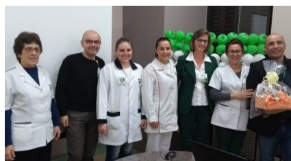
HSI em palestras enfatizou a contribuição da enfermagem na gestão da qualidade

A 1ª Semana de Enfermagem da RSDP abordou a melhoria da assistência por meio dos cuidados. Cada hospital deu ênfases específicas, desde a importância dos cuidados paliativos, passando pela responsabilidade na comunicação e transição do cuidado até a apresentação de cases de sucesso.