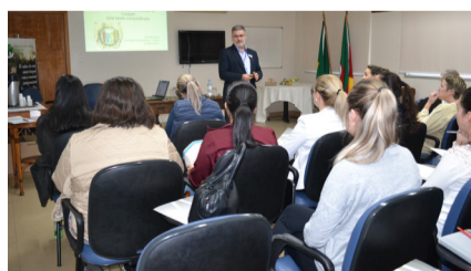
HE discutiu as responsabilidades na gestão dos cuidados e conheceu as práticas do Ambulatório 1º de Maio