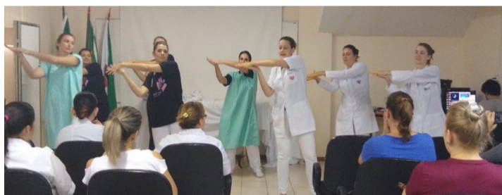
HSJ promoveu uma encenação com música sobre o tema