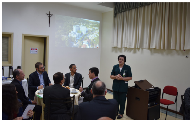
A imprensa gaúcha foi convidada para um coquetel onde conheceu nossa história e planos para o futuro