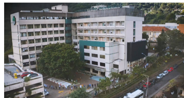
Na terça, 28, o abraço coletivo ao hospital. Uma forma de retribuirmos o ambiente carinhoso e fraterno onde trabalhamos