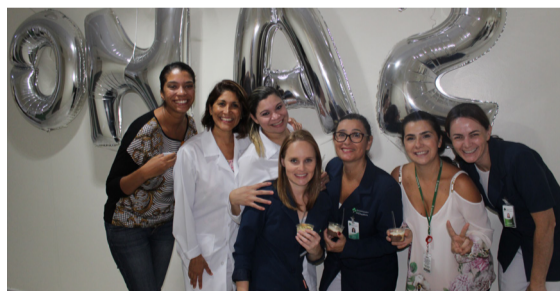
Hospital Divina Providência