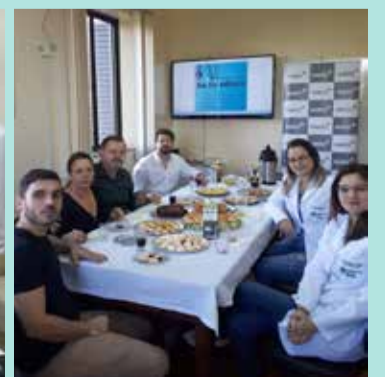
Hospital São José