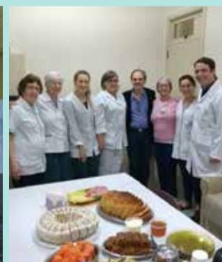
Hospital Santa Isabel