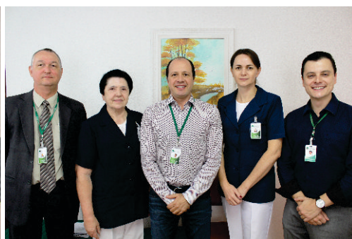
Comitê Gestor do Hospital Divina Providência