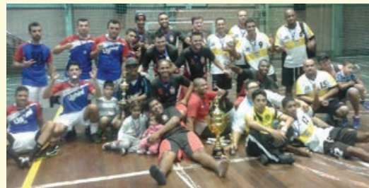
Equipes “Boka Braba”, do Divina, campeã (centro), vice-campeão “Barcelona FC”, do Independência, à esquerda, e “Ai se eu te pego”, do Divina, à direita.

de confraternização dos atletas, família e amigos que prestigiaram o evento. Para a garotada foi disponibilizado um playground onde a diversão foi garantida. A direção da Associação parabeniza todos que abrilhantaram este momento de integração das equipes do Divina e do Independência.