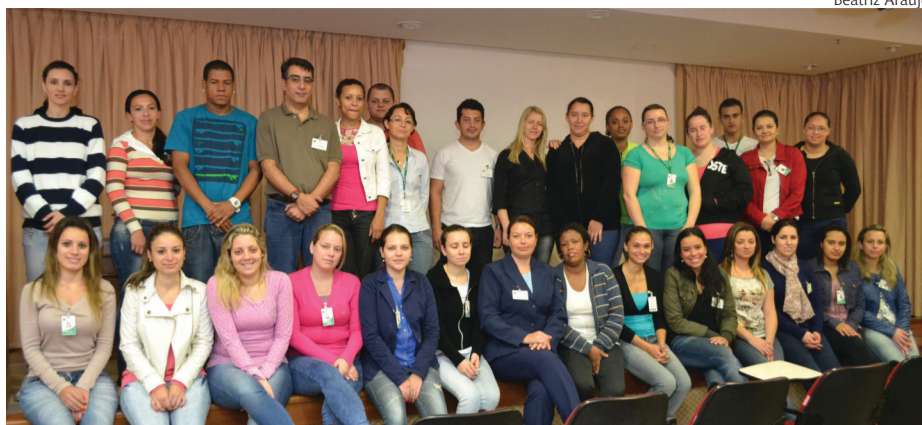
Trinta funcionários concluíram o Programa de Orientação Geral promovido pelo Centro de Educação Continuada. A qualificação ocorreu no dia 25 de agosto, no Auditório Padre Eduardo Michelis.