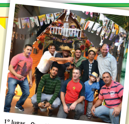
1º lugar - Quentão, da Manutenção

A barraca mais enfeitada foi a do Quentão, da equipe da Manutenção. Em segundo lugar ficou a Espetinho Doce, do CMI, e em terceiro, a Hot Dog do Rex, da Emergência.