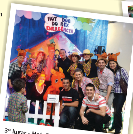
3º lugar - Hot Dog do Rex, da Emergência