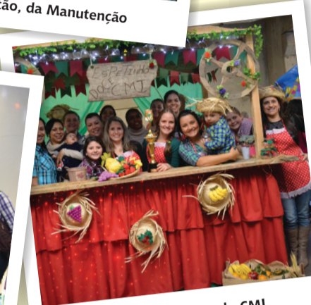
2º lugar - Espetinho Doce, do CMI